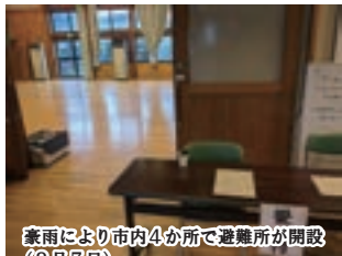
豪雨により市内4か所で避難所が開設 (8月7日)

災害発生時における地域や家庭でのスムーズな避難計画の重要性を訴え、現状本市に転入された方へ配布しているパンフレット「防災の備え」の全戸配布と、発災時にどう動くかを検討するためのツール「マイタイムライン