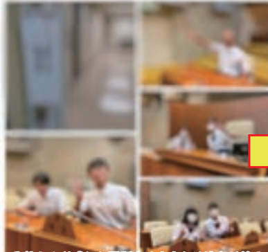
生徒さんが感じた問題点は大人とは違う目線!! 気づきにくい鋭い視点に刺激をもらいました。

7/25には、天童四中の生徒さんとの意見交換会が行われ、大人とは違った鋭い視点の質問や疑問など、こちらも勉強になりました。お伺いしたご意見は、市役所担当課へお伝えしました。