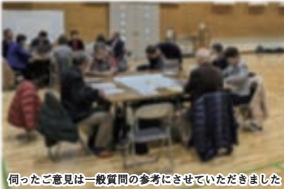
伺ったご意見は一般質問の参考にさせていただきました

議員が天童市内の各公民館に伺い、地域の皆さんとの意見交換会を行ってきました。私の担当は5/21の南部公民館と5/22の山口公民館の2カ所。普段お住いの地域が抱える課題や市政に対しての貴重なご意見をいただきました。